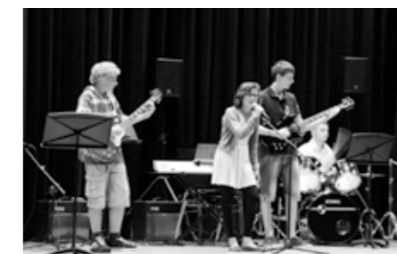
Die Rockband der Musikschule Neuheim in Action